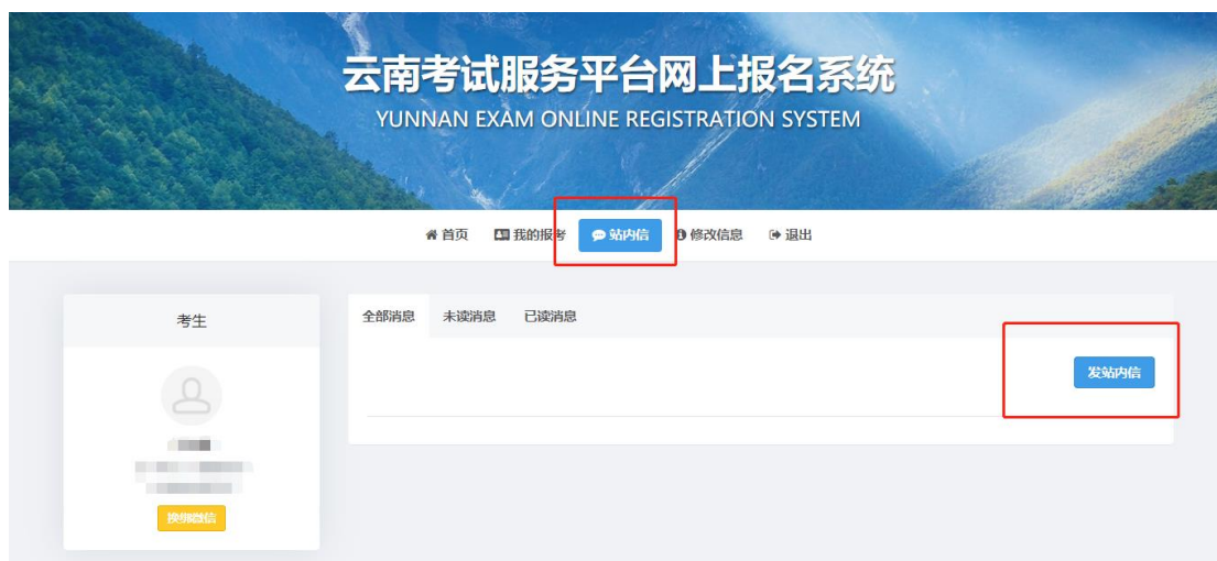
(图例：站内信发送方式)