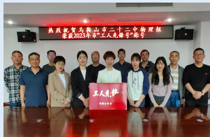
物理组获“工人先锋队”称号

学校现有42个教学班，在校学生近2200人。现有教职工153人，专任教师149人。其中，正高级教师2人，高级教师73人，省特级教师2人，省学术和技术带头人1人，享受省政府特殊津贴1人，全国巾帼建功标兵1人，省优秀教师3人，省劳动模范1人，市学科带头人2人，市骨干教师12人，市教坛新星2人。